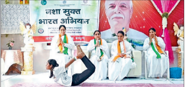
बहादुरगढ़। कार्यक्रम में योग करके दिखाती युवती।