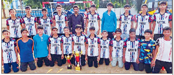
झज्जर। प्रशिक्षकों के साथ उपस्थित हैडबॉल टीम के विजेता खिलाड़ी।