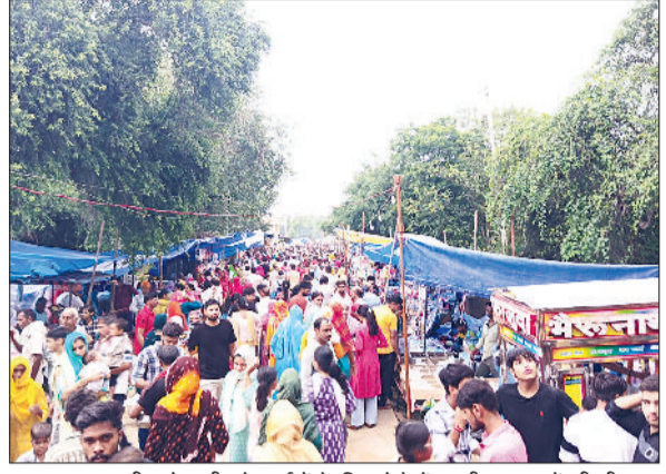
झज्जर। जहावर गंगा पीर के दर्शनों के लिए मेले में उमड़ी श्रद्धालुओं की भीड़।

सोलह कलाओं से युक्त भगवान श्री कृष्ण का जन्मोत्सव धूमधाम से मनाया गया। शहर में चारों ओर जन्माष्टमी की धूम देखी