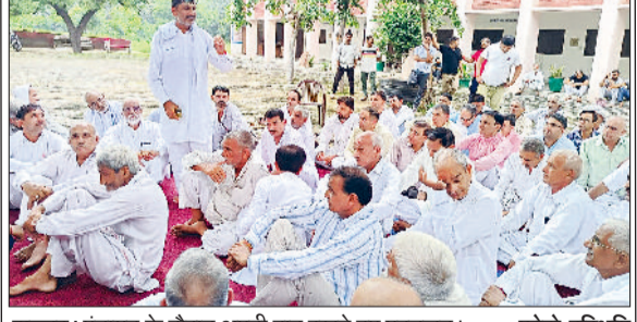
झज्जर। पंचायत के दौरान अपनी बात रखते हुए प्रबुद्धजन।