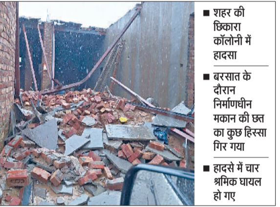
हरिभूमि न्यूज ॥ बहादुरगढ़