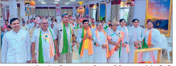
बहादुरगढ़। कार्यक्रम में उपस्थित ब्रह्माकुमारियां व अतिथि।

पर्व उत्साहपूर्वक मनाया गया। भजन कीर्तन के बाद प्रसाद वितरित किया गया। रात तक झांकियों को देखने का तांता लगा रहा। पंडित महेंद्र शर्मा ने बताया कि भगवान ने भाद्रपद मास की कृष्ण पक्ष की अष्टमी तिथि की मध्यरात्रि को कंस का विनाश करने के लिए मथुरा में जन्म लिया था। भगवान स्वयं इस दिन पृथ्वी पर अवतरित हुए थे, इसलिए इस दिन को कृष्ण जन्माष्टमी के रूप में मनाया जाता है।