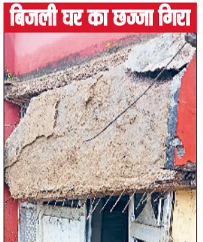
बिजली घर का छज्जा गिरा

शहर की छिकारा कॉलोनी में हादसा हो गया। यहां बरसात के दौरान निर्माणधीन मकान की छत का कुछ हिस्सा गिर गया। इससे मजदूर सहित चार लोग घायल हो गए। सभी की हालत खतरे से बाहर है। वहीं, बरसात के कारण बिजली घर में भी छज्जे का मलबा गिर गया। हादसा 15 अगस्त की दोपहर को हुआ। जानकारी के अनुसार, यहां छिकारा कॉलोनी में देवेन्द्र नाम के एक शख्स द्वारा मकान का निर्माण कराया जा रहा है। कुछ समय पहले ही छत डाली गई थी। शुक्रवार को बरसात के दौरान छत को सहारा देने के लिए लगा स्मोर्टर हट गया। इससे छत के आगे का हिस्सा गिर गया। इस दौरान निर्माण कार्य में लगे महेंद्र,