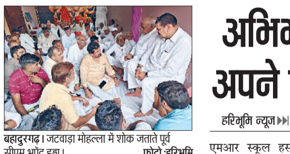
बहादुरगढ़। जटवाड़ा मोहल्ला में शोक जताते पूर्व सीएम भूपेंद्र डुड्डा।