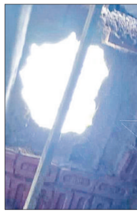
बहादुरगढ़। मलबा गिरने से स्कूल के कमरे की छत में बना छेद।

बहादुरगढ़। इलाके में सरकारी शिक्षण संस्थानों के भवनों की हालत दिनोंदिन बदहाल होती जा रही है। कई विद्यालयों के कमरे पहले ही कंडम घोषित किए जा चुके हैं, वहीं कई इमारतें इसी स्थिति की ओर बढ़ रही हैं। आप दिन कहीं न कहीं छत से मलबा गिरने के मामले सामने आ रहे हैं। ताजा मामला गांव आसौदा सिवान के राजकीय कन्या वरिष्ठ माध्यमिक विद्यालय का है। यहां वीरवार को बरसात के बीच एक कमरे की छत का हिस्सा अचानक टूटकर नीचे गिर गया। छत पर बड़ा छेद बन गया। गनीमत रही कि कोई छात्रा या शिक्षक इसकी चपेट में नहीं आया।