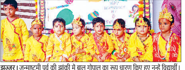
झज्जर। जन्माष्टमी पर्व की झांकी में बाल गणपाल का रूप धारण किए हुए नर्तक विद्यार्थी।