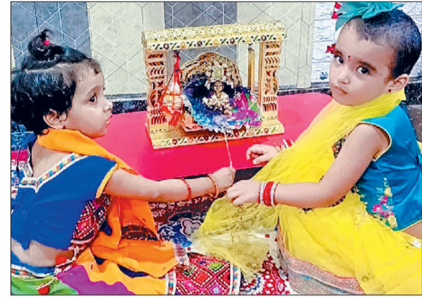
बहादुरगढ़। एक घर में भगवान कृष्ण के बाल रूप को झुलाते बच्चे।